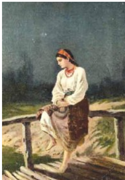
К. Трутовський. «Покинута»

Розгляньте репродукції і охарактеризуйте їх. (Роздуми-відповіді учнів).